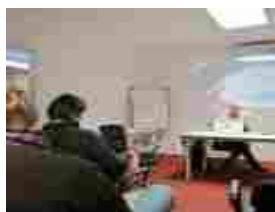
Interazioni tra Arte e Scienza: tra funghi, time lapse e diorami per ScienzArt