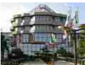
Bari, muore durante un'intervento chirurgico, 7 indagati