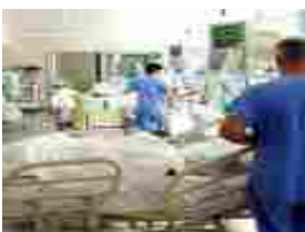
Sanità: professionalità sacrificate all'altare delle lottizzazioni