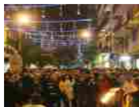
A Bari il Natale è per tutti. Tanti eventi sotto il segno della solidarietà